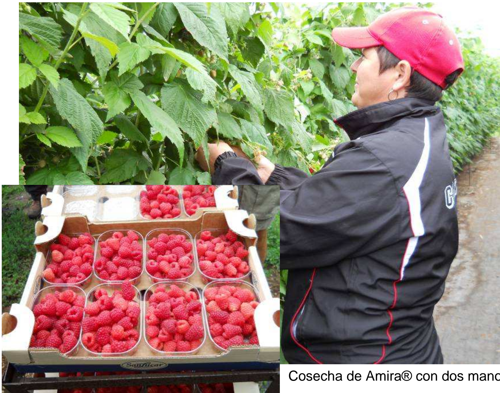
Cosecha de Amira® con dos manos