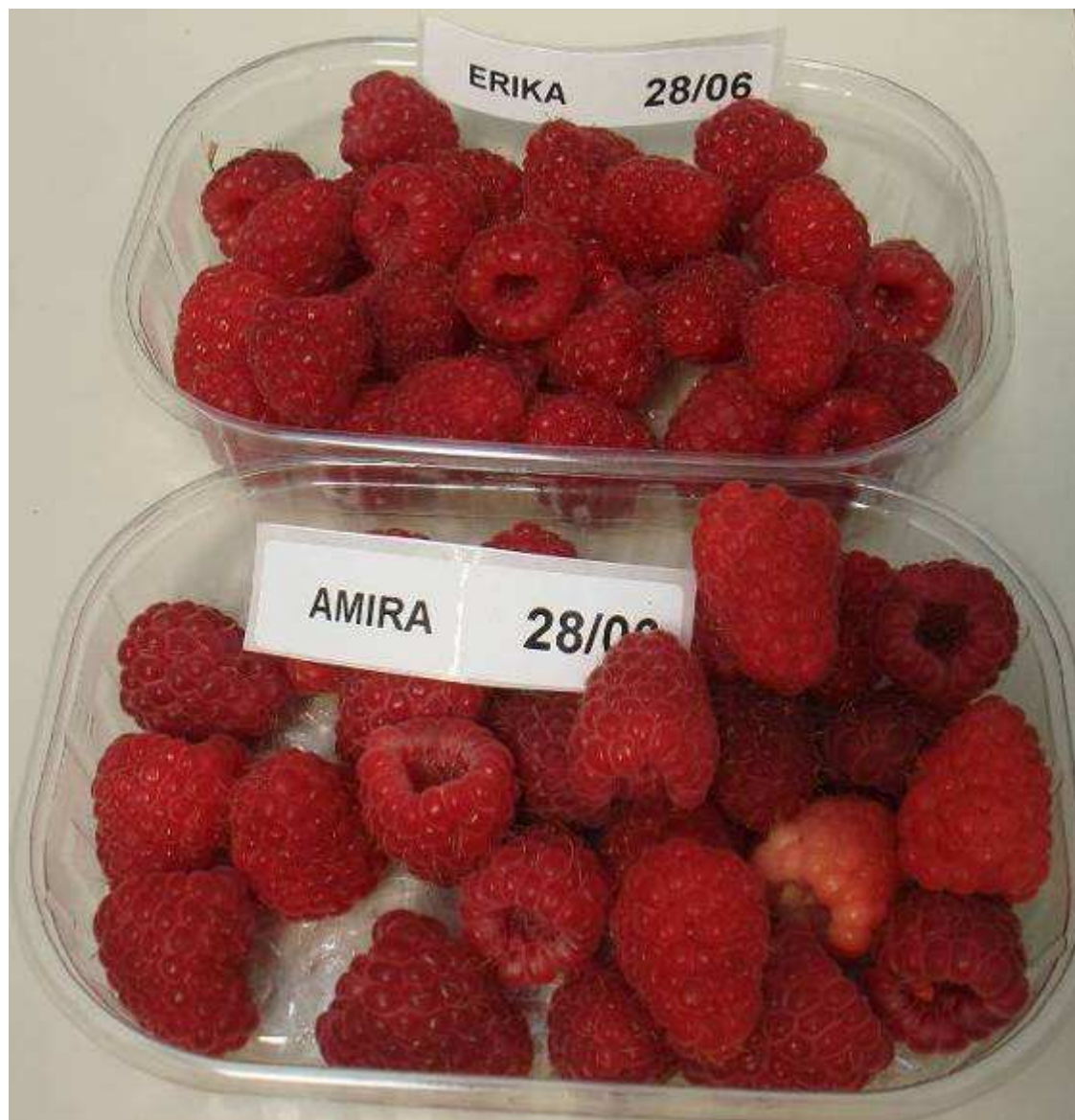
Amira ® cosechada el 28 de Junio en Verona v/s Erika ®