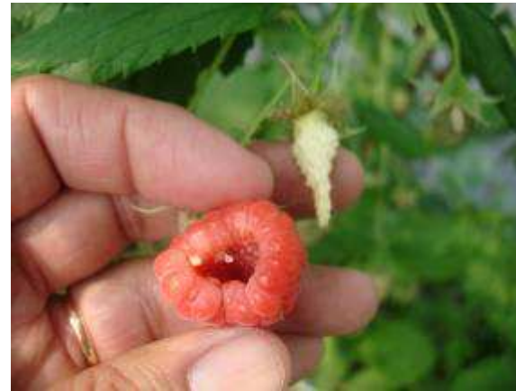
Amira® se desprende facilmente