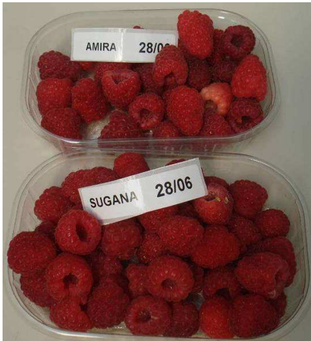
Amira ® cosechada el 28 de Junio en Verona v/s Sugana ®