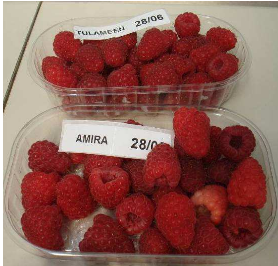
Amira ® cosechada el 28 de Junio en Verona v/s Tulameen